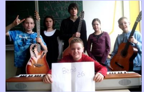
Rockband - AG