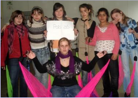
Poi - AG