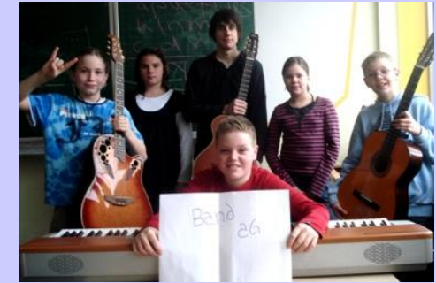
Rockband - AG