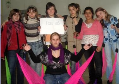
Poi - AG