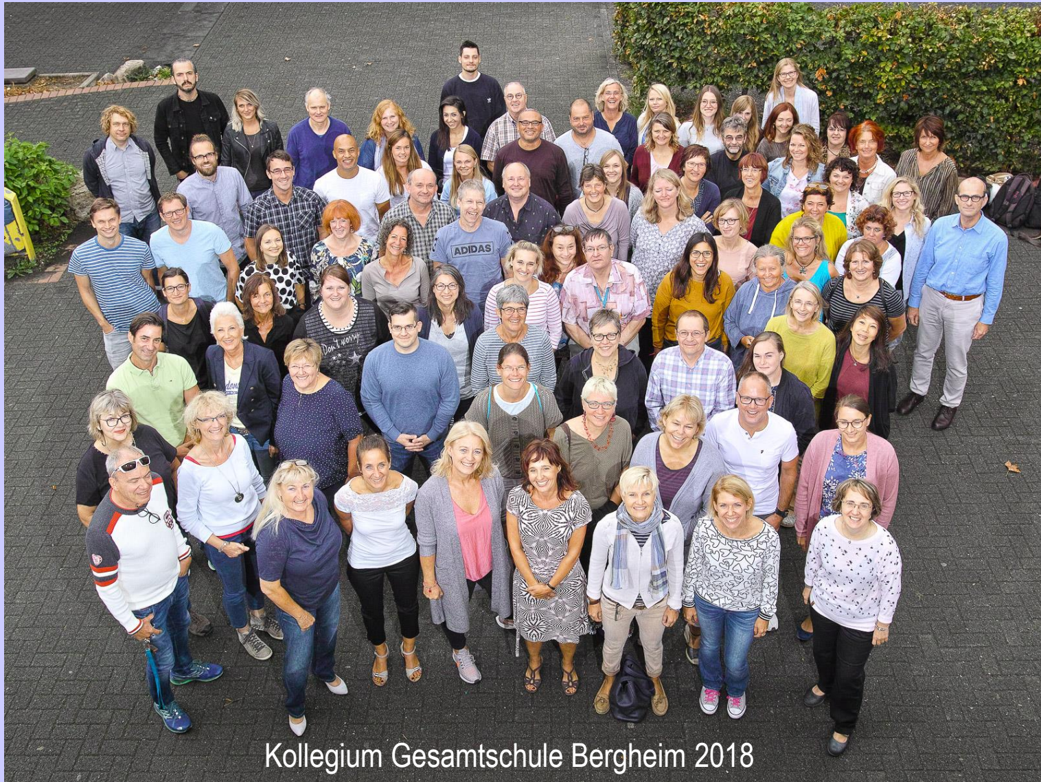
Kollegium Gesamtschule Bergheim 2018