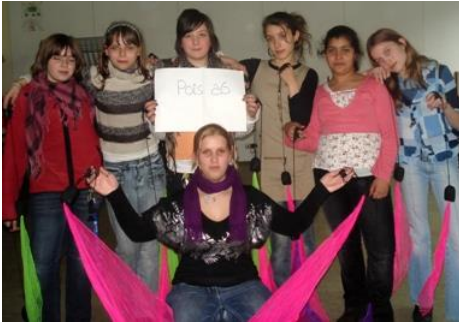
Poi - AG