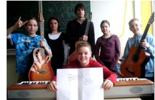
Rockband - AG